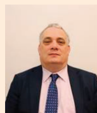
Aengus Ó Snodaigh TD (Cathaoirleach) Sinn Féin