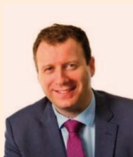
Pádraig Ó Súilleabháin TD Fianna Fáil