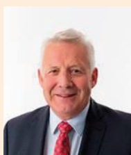
Fergus Ó Dubhda TD Fine Gael